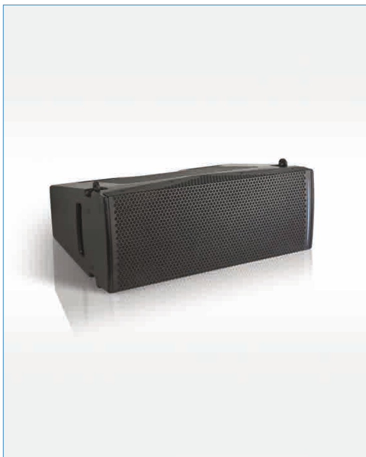
Enceinte "line array" UC206W

Le système Uniline Compact est un système « line array » modulaire basé sur le même concept que le système Uniline. Il se compose de trois enceintes UC206N, UC206W et UC115B. Grâce à sa modularité acoustique et mécanique quasi illimitée, il convient aux applications de courte et moyenne portée, dans les cas d'utilisation pour lesquels la compacité, la discrétion et la praticité du système s'imposent.